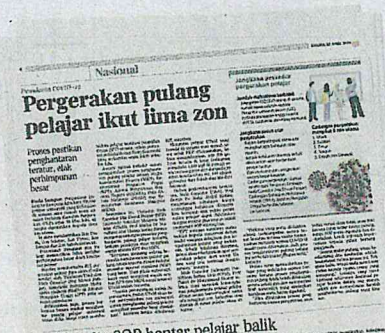
Keratan akhbar BH semalam.

"Penting untuk pihak polis mengatur perjalanan supaya tidak berlaku kesesakan di jalan raya atau di hentian di lebuhraya," katanya yang berkata butiran mengenainya akan diumumkan nanti.