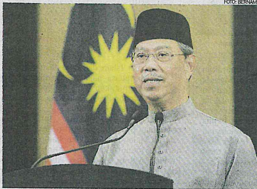
Muhyiddin ketika menyampaikan perutusan khas yang disiarkan secara langsung menerusi stesen televisyen tempatan dan media sosial malam tadi.

Muhyiddin bagaimanapun berkata, kerajaan bersetuju memberi sedikit kelonggaran