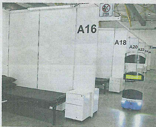
Robo-delivery: A robot delivering food in the quarantine facility at the Malaysia Agro Exposition Park Serdang. So far, 3,542 patients have recovered from Covid-19 in Malaysia.

ue to monitor developments of Covid-19 and Malaysians will be informed from time to time," he added.