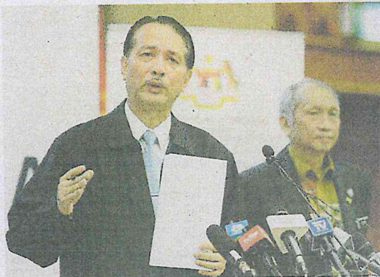
Health director-general Datuk Dr Noor Hisham Abdullah (left) speaking at a Covid-19 press briefing in Putrajaya yesterday.

He said if border control was loosened, those who entered the