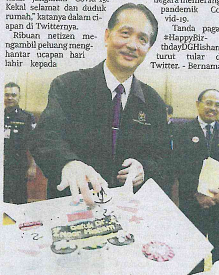
DR Noor Hisham ketika meraikan sambutan ulang tahun kelahiran ke-57 beliau selepas sidang media.

Tanda pagar #HappyBirthDayDGHisham turut tular di Twitter. - Bernama