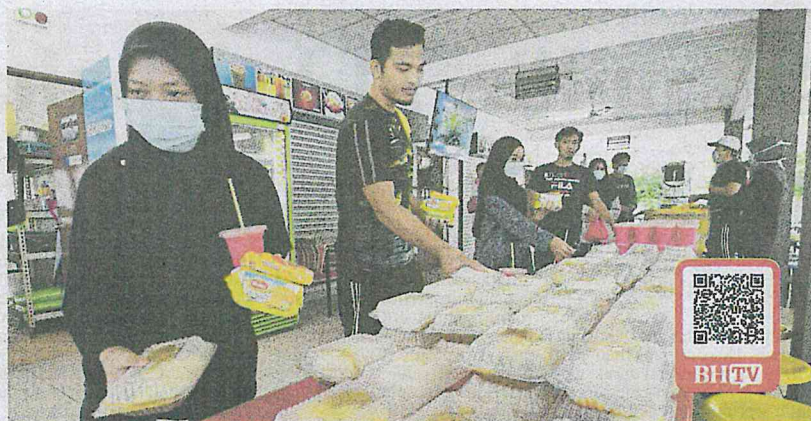
Pelajar Politeknik Ibrahim Sultan, Johor Bahru yang terkandas di kampus sepanjang PKP mengambil makanan disediakan pihak pentadbiran.