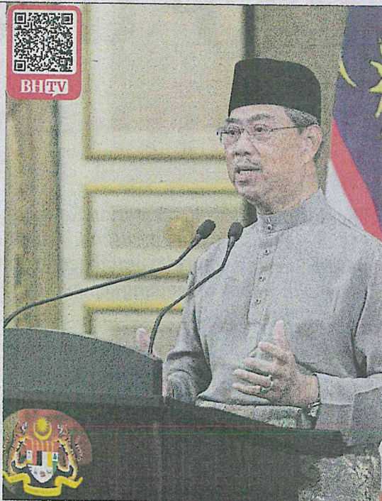
Muhyiddin menyampaikan perutusan khas disiarkan secara langsung menerusi stesen televisyen tempatan dan media sosial di Putrajaya, malam tadi.